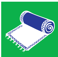
Les tapis et les tentures