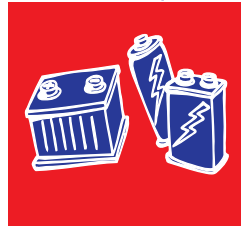
Les piles et batteries