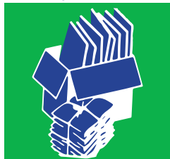
Les cartons pliés et/ou fagottés