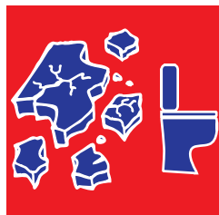
Les gravats et céramiques