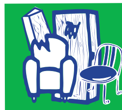
Les meubles en bois et le mobilier