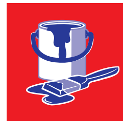
Les produits chimiques